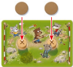
Placa de base

(con el cuervo arquitecto hacia arriba). Las 22 tiras de madera restantes se ponen al lado como reserva de manera que estén a mano.